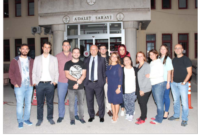
Bursa Barosu ekibi, Çakırözü Köyü'ne gitmeden önce Afyon Adale Sarayı'nda Afyon Barosu ekibiyle buluştu.