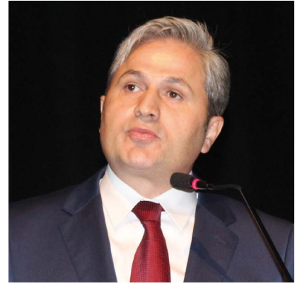
Av. Şerafettin Yavuz

hukukun üstünlüğüne ve yargı güvenilirliğine bağlı olduğunu söyleyen Demiröz, "Hukuk, ayaklar altındaysa hukukçular da ayaklar altındadır. Yargının yeniden inşası konusunda özellikle avukatlar görev düşüyor. Biz, kim olursa olsun insanların