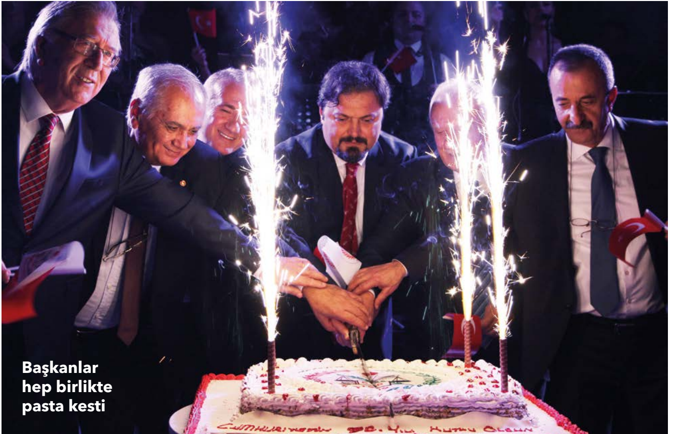
Başkanlar hep birlikte pasta kesti