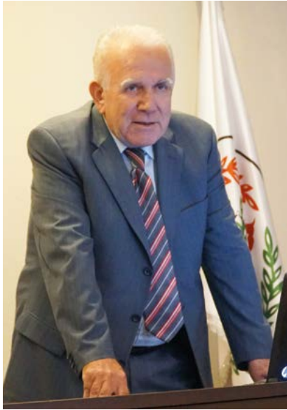
Av. Şinasi Özer

Ufuk Özer'in verdiği bilgiye göre tazminatonline.com,