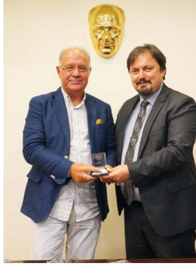
Av. Halil Tomruk