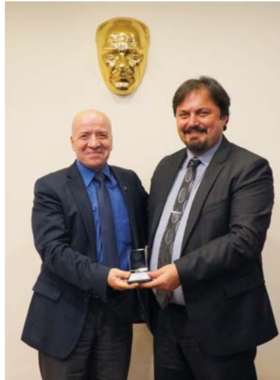
Av. Tayfun Gündoğdu