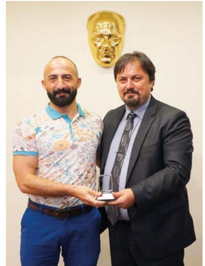
Av. Murat Öztürk