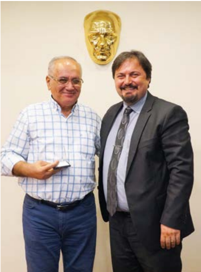
Av. Yahya Şimşek