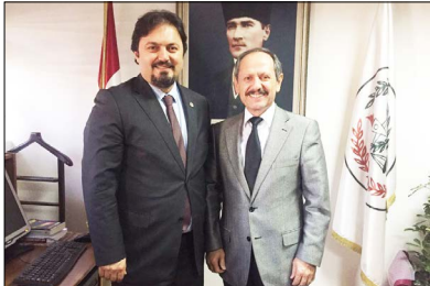
Adli Yargı Adalet Komisyonu Başkanı Ali Rıza Bir