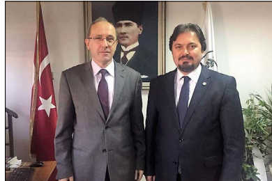
Bursa 7. Ağır Ceza Mahkemesi Başkanı Kemal Yılmaz